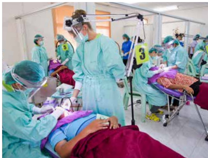
■ 牙科主要醫護成員來自拉瑪醫院，十四張診療椅同時進行服務，讓民眾免於豔陽下久候。

聲音放到病患的耳邊，殷殷垂詢民眾「聽得到聲音嗎？」這是聽力初步檢驗。「靜」是耳鼻喉科診間的一大特色，和牙科診間的磨牙切齒聲大不相