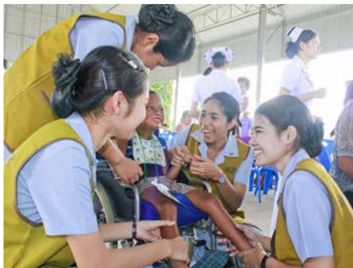
■ 暖武里護理學院的學生們一同關懷患有智能障礙的孩子，讓他露出燦爛的笑容。攝影／桑瑞蓮

耳鼻喉科主要醫護成員來自越烹醫院，由蔡旺倫院長帶隊參加。他除了帶動全院醫護人員勤耕大愛農場有機稻米，今天更邀請他們前來守護對大城府鄉民的愛。馬蹄型的聽力檢測音叉輕敲著醫師的手肘，引出清脆的