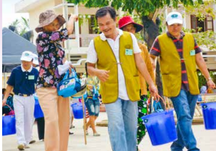
■ 志工奉上生活物資與醫療包給予來看診的民眾，並幫他們一路提至門口。

區。清晨五點半，志工在胡志明市集合，前往三十多公里外的芽皮縣。這是慈濟今年的第一場，也是當地許多老人家的第一次。義診開幕儀式委由當地紅十字會主持，慈濟志工也以手語歌曲「幸福的臉」揭開序幕。