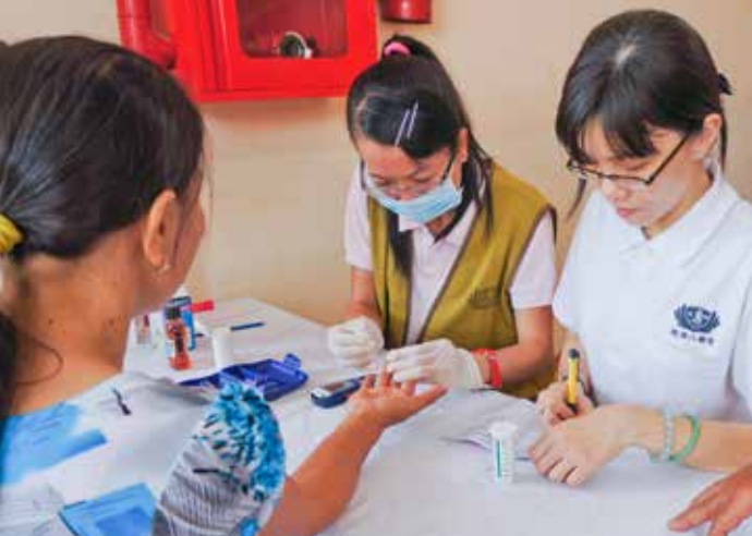
■ 人醫會與慈濟志工在義診現場幫民眾量測血糖。