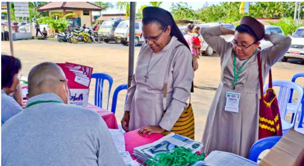
■ 曾接受過慈濟協助的天主教夏威夷育幼院修女，這次特地前來協助義診，表達內心的感恩。