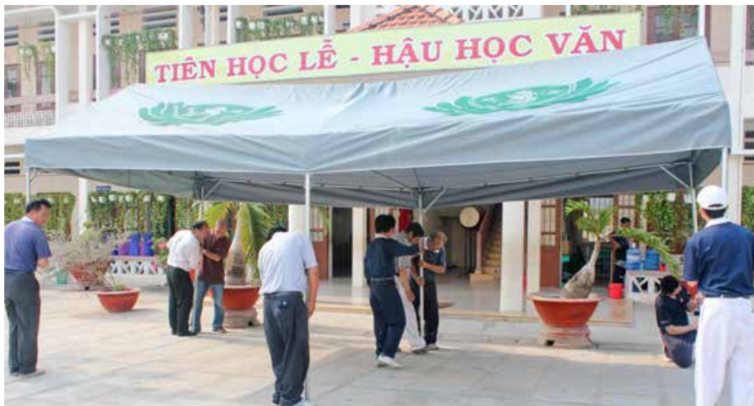
■ 志工合力搭設印有慈濟法船標誌的帳篷，布置為義診發藥區。

依循往例，慈濟志工提前一天到現場布置。印有慈濟法船標誌的帳篷首次在義診場地現身，將規劃為發藥