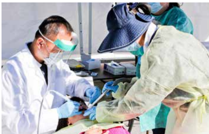
■ 除了志工之外，家屬也是義診的對象，圖為人醫會牙醫師正在為志工家屬檢查牙齒。