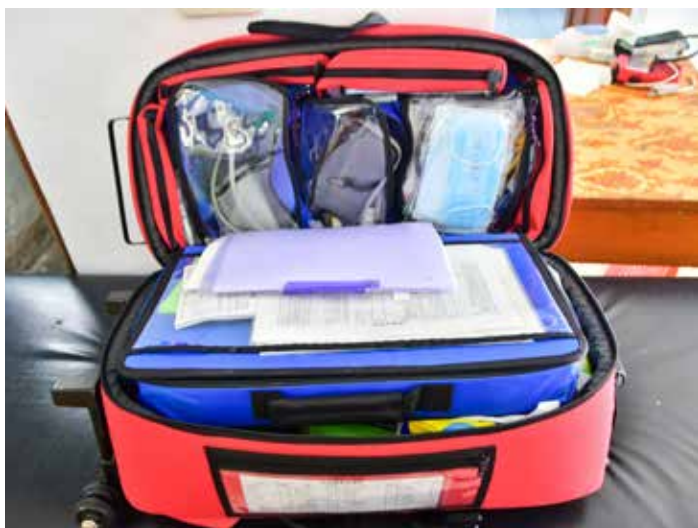
巡迴醫療包內，裝載醫材等物，是山巡醫療團隊不可或缺的救人利器。

人士捐贈供作山巡專用。打從二〇〇一年南橫IDS醫療服務啟動，迄今已經更換第五輛車，除了第一輛為救護車，其他三輛皆為廂型車。