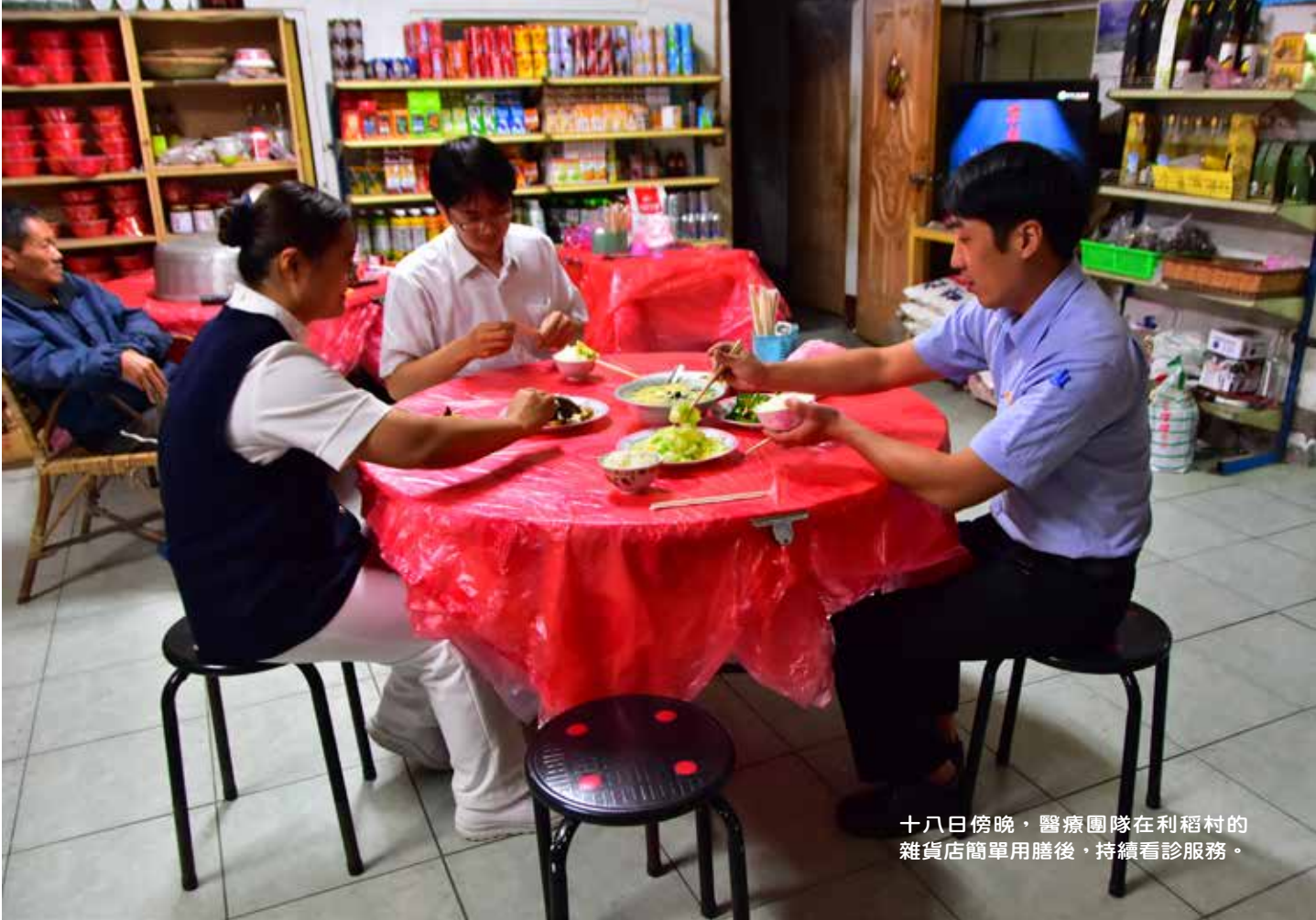
十八日傍晚，醫療團隊在利稻村的雜貨店簡單用膳後，持續看診服務。