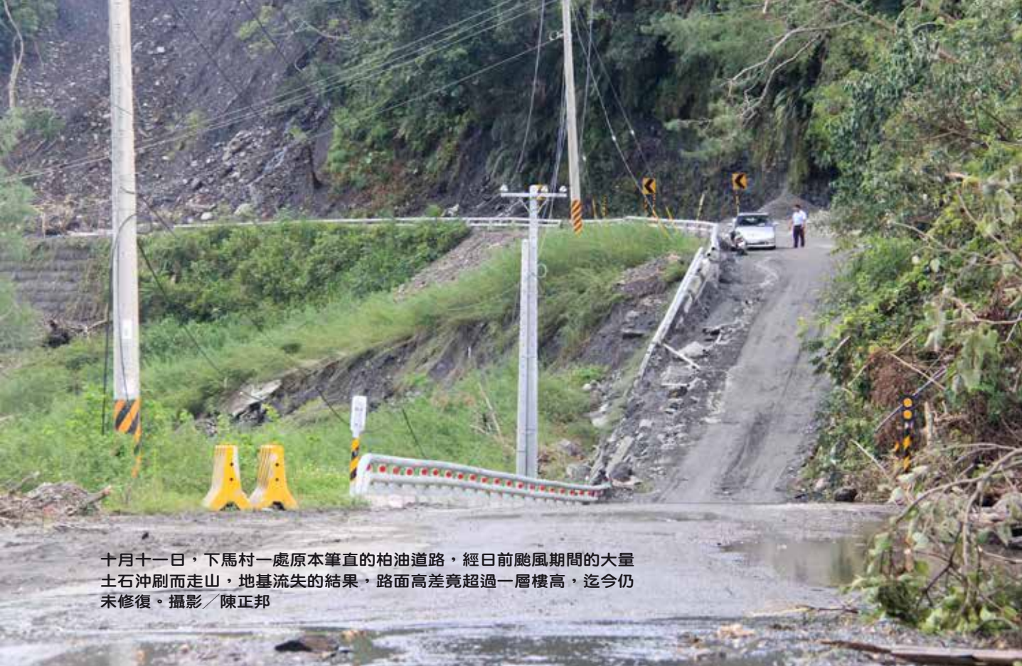
十月十一日，下馬村一處原本筆直的柏油道路，經日前颱風期間的大量土石沖刷而走山，地基流失的結果，路面高差竟超過一層樓高，迄今仍未修復。

光亮了起來，紅通通的天龍吊橋身形若隱若現，坦途就在不遠處，同仁們將拾來充當柺杖的木條依序整齊倚靠在天龍吊橋的入口處。這時張醫師突然說道：「留給下一個要入山的人吧！」陪伴眾人走過險途的木條，霎時都昇華成了愛心登山杖。