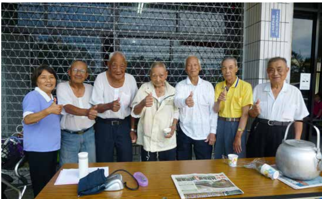
不計較佔用自己休息時間，全時守護長者需求，擄獲了一顆顆銀髮族的心。

平日探望社區老人，若長輩遇到任何疑問，志工便能立即協助。十三名社區志工每月探望獨居老人，記載簡要就醫情形、生活現況等，做心靈陪伴，也回報長者的需求。過年過節，寫卡片慰問及致贈麵線、麥片等，行動不便長輩及獨居者都受惠。