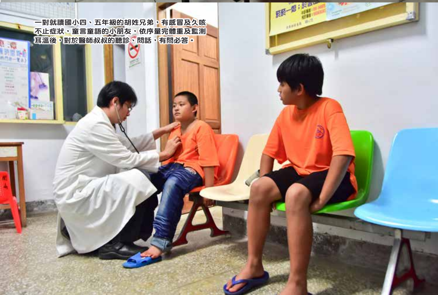
一對就讀國小四、五年級的胡姓兄弟，有感冒及久咳不止症狀，童言童語的小朋友，依序量完體重及監測耳溫後，對於醫師叔叔的聽診、問話，有問必答。