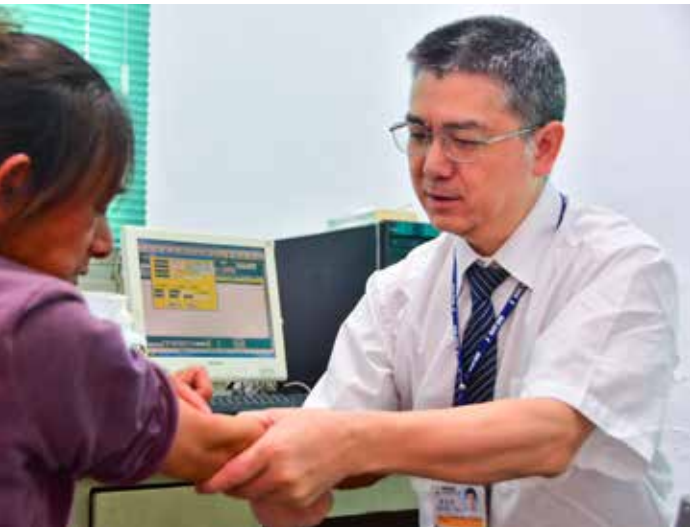
銀亮鏡框熠熠，一頭烏黑點綴幾撮白髮，斯文俊秀，張醫師對於原鄉部落，他始終有著一分難以割捨的情懷。

稻過夜。而村長也廣播，山下發生土石流，村民都不可以下山。隔天路況允許下山時，我們的車輛壓到石頭，又發生了第二次的爆胎！總務股同仁馳援現場，更換輪胎。」「七年前，有一次為了要上山看診，甚至還以流籠作為交通工具，驚險萬分。」現在因為安全考量，流籠已經被拆除了。